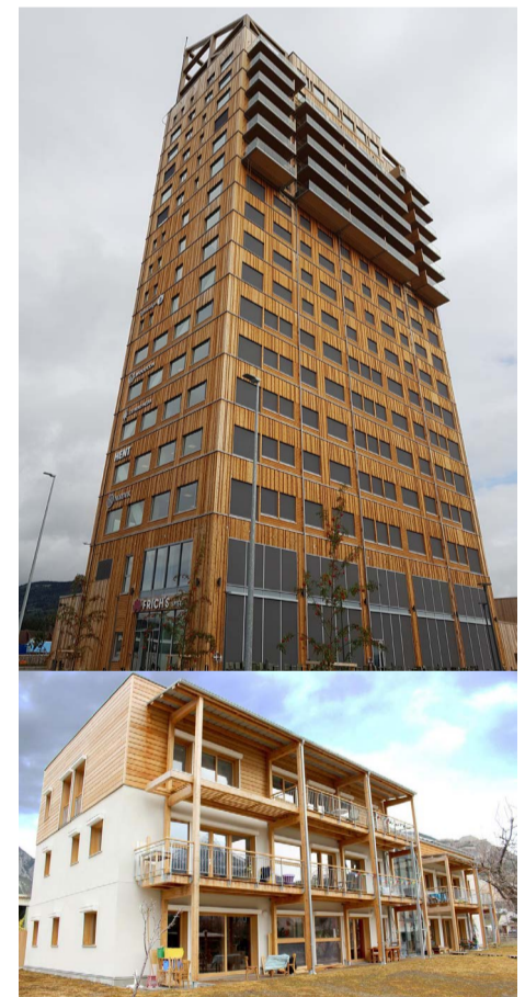
© Olivier Gaujard, 2019, Immeuble en bois actuellement le plus haut du monde (85,50 mètres) situé en Norvège, "Mjøstårnet" ce qui signifie «La tour du lac».